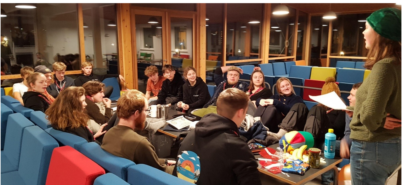
Klan Hans (unge spejdere 16-22 år) planlægger det sidste til natløbet for troppen på juleturen.